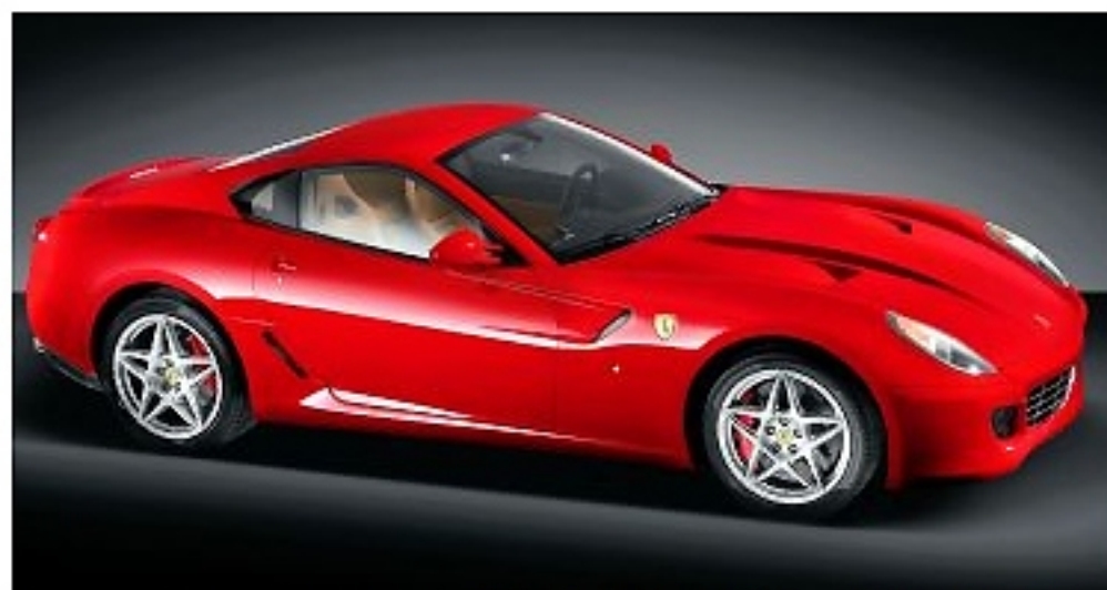
Ferrari 599 GTB byder på 620 potente hestekræfter. Skal du købe bilen, koster den 6.000.000 kroner...