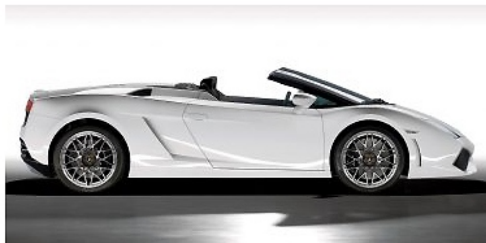
Lamborghini Gallardo Spyder. Nypris: 4.500.000 kroner – inklusive V10 motor